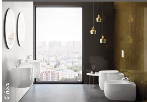
La ligne Beyond de Roca propose plusieurs vasques et lavabos, une baignoire îlot en solid surface mat et des WC au sol ou suspendus.