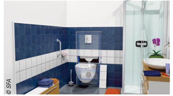
Avec sa version UP, le célèbre broyeur de SFA peut aussi prendre place partout, y compris derrière n'importe quelle cuvette traditionnelle.

encore avec leur smartphone ! Enfin, son design garantit une intégration idéale en salle de bains contemporaine.