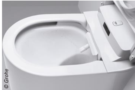
Sensia Arena de Grohe : un concentré de technologie pour assurer l'hygiène intime et une conception étudiée pour garantir un entretien facilité à l'extrême.