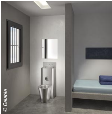
Y compris en univers carcéral, le WC peut avoir du style. Ici, le combi Kompact à poser au sol avec lavabo intégré et porte-papier encastré de Delabie.