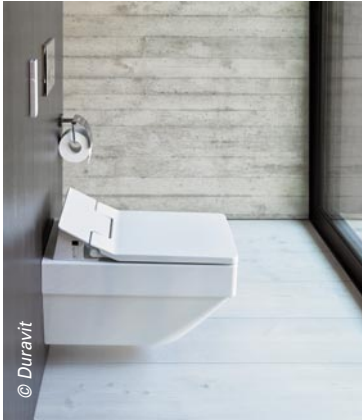
Le lavant Duravit avec son abattant SensoWash coordonné aux différentes séries design de la marque. La partie technique est astucieusement dissimulée pour un aspect visuel parfait.