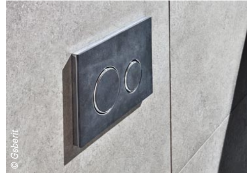
La plaque de déclenchement Geberit, composée d'un seul bloc fin d'ardoise noire.

technique (économies d'eau, hygiène, endurance, installation facilitée, ergonomie, etc.). Cette année, l'entreprise a d'ailleurs remporté le German Design Award 2018, avec la mention Winner, pour son nouveau robinet électronique d'urinoir Tempomatic 4. Son objectif est désormais de rendre le design abordable en réduisant les coûts des sanitaires en Inox, qui doivent s'aligner sur ceux de la céramique haut de gamme, afin d'offrir une alternative compétitive. Même les plaques de déclenchement s'y mettent ! La preuve avec Geberit, qui vient de sortir un modèle avec une finition en pierre naturelle : l'ardoise. Ce matériau traditionnellement employé pour la couverture des bâtiments bouscule les usages en entrant dans la salle de bains. Robuste et original, l'ardoise apporte indéniablement une touche de design contemporain et d'authenticité au coin toilette !