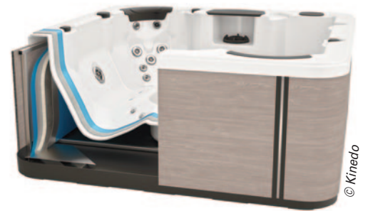
Les spas Kinedo Expert sont conçus, fabriqués et testés intégralement en France, sur le site Kinedo de La Ciotat (Alpes maritimes).

avec la robinetterie dans le regard externe. Elles sont déclinables en diamètres de 1 000 à 2 400 mm et affichent une hauteur de cuve jusqu'à 8 mètres.