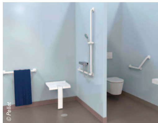
La gamme Ergolife de Pellet est disponible en deux versions pour un design contemporain : avec ou sans embases.

Jackoboard propose également un ensemble d'éléments 100% étanches pour réaliser des parois, des meubles, des coffrages, des habillages de bâti-support WC pour l'ensemble de la salle de bains.