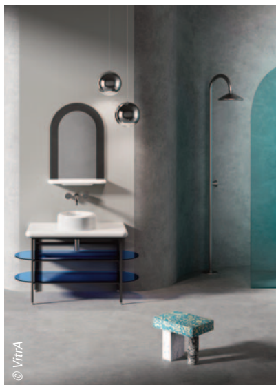
Liquid de Vitra : depuis son lancement, la collection a reçu plusieurs prix, dont deux prestigieux Red Dot Design Award pour les carreaux de céramique d'abord, puis pour l'ensemble des produits de salle de bains.