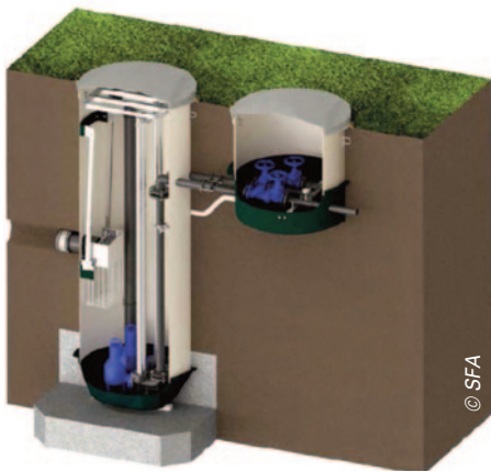
Quatre couvertures possibles pour les postes de relevage SFA : couvercle simple ou articulé (sous espace vert), avec un coffrage perdu (sous dalle) ou encore sans couverture (sous voirie).