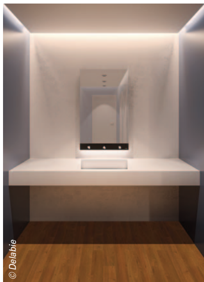
L'armoire de Delabie a été pensée pour faciliter son installation et son entretien.